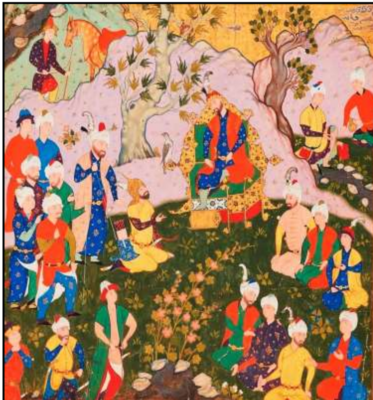
تصویر ۱: آمدن سفیر سلم و تور نزد فریدون (بخشی از اثر)، اثر صادقی بیگ، شاهنامه شاه اسماعیل دوم، ۹۸۴ق، در گوشه سمت راست بالا امضای صادقی بیگ دیده می شود (وبگاه موزه آقاخان، ۱۳۹۹)