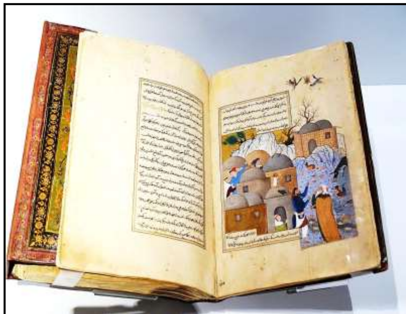
تصویر ۲: نسخه مصور انوار سهیلی محفوظ در موزه آقاخان، سفارش داده شده و مصورسازی شده توسط صادقی بیگ،

صفحه مربوط به نگاره «لاکپشت و مرغابی‌ها» (وبگاه موزه آقاخان، ۱۳۹۹)