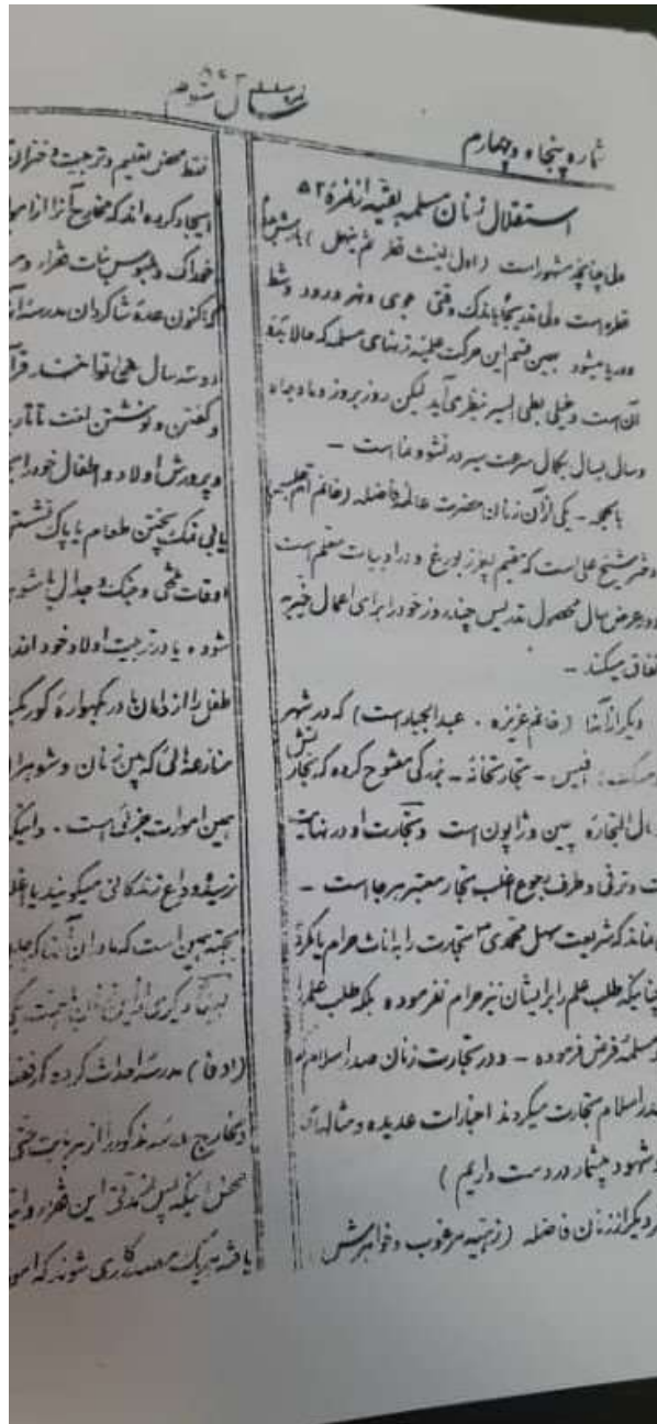
مقاله استقلال زنان مسلمان، روزنامه مظفری، شماره ۵۴