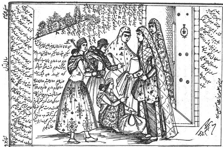
(روزنامه شکوفه، ۳ جمادی‌الثانی ۱۳۳۱: ۱)