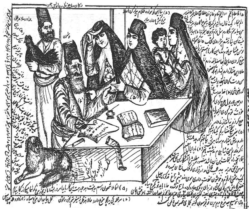
(روزنامه شکوفه، ۲۴ جمادی الثانی ۱۳۳۱: ۱)