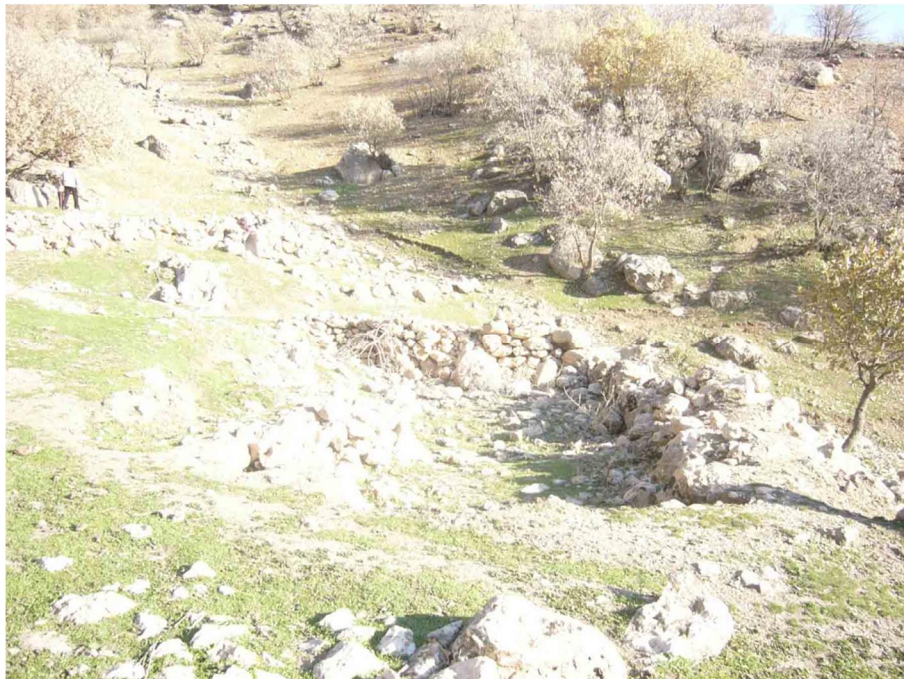
شکل 10 بقایای بازمانده زمگه در آسمان‌آباد

کوچ‌نشینان به‌مثابه جامعه‌ای منسجم و متشکل را نمی‌توان به‌دلیل تبدلات سیاسی و فرهنگی که در گذشته بین آن‌ها وجود داشته است، به منطقه خاصی محدود کرد؛ اما همواره این‌ها دارای قلمروی زیستی خاصی بوده‌اند که با توجه شرایط سیاسی و فرهنگی، احتمال تغییر در آن وجود داشته است. برای مثال، جنگ تحمیلی بر شیوه کوچ‌نشینی مناطق مختلف تأثیر گذاشت و باعث شکل‌گیری کوچ‌های درون‌منطقه‌ای شد.