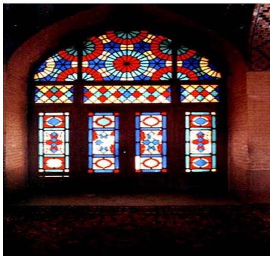
شکل ۲ نمایی از داخل یک فضای تاریخی که استفاده مطلوب از پنجره‌های مشبک را نشان می‌دهد

تعاملات اجتماعی بین ساکنان اهمیت داشته است. چنان‌که بررسی دقیق‌تر بافت تاریخی شهرهای سنتی، تلاش کالبد بافت را در جهت ایجاد نظارت همگانی و حفظ قلمرو طبیعی - که از پایه‌های اساسی ایجاد فضای قابل دفاع و نیز از اصول مهم نظریه‌های نیومن و جیکوبز به‌طور مشترک بوده است - نشان می‌دهد. کرو نیز در این باره می‌گوید برای ایجاد دسترسی مطلوب و کاهش دسترسی مجرمان می‌توان از نظارت‌های عمومی بر معابر و مسیرهای دسترسی بهره گرفت (خاموشی، ۱۳۸۷: ۱۵۶؛ Crow, 2000: 43-67). جهت‌گیری پنجره بناها به سمت معابر و میادین محلات بافت در واقع به دلیل افزایش میزان کنترل و پایش فضا از جانب ساکنان شهرهای سنتی در ایران است؛ معابری که در شهرهای کویری بافت کهن بنا بر ملاحظات اقلیمی اغلب دیوارهای بلند و عرض کمی دارند؛ این ویژگی اهمیت لزوم چنین مراقبتی را از فضا دوچندان می‌کند. این پنجره‌ها که گاهی در شکل پنجره‌های مشبک بسیار زیبا نمود پیدا می‌کنند، ضمن عهده‌دار شدن نقش کنترلی خود، حریمت فضاهای درونی ساکنان را که تمایل به حفظ آن را دارند، تأمین می‌کند.