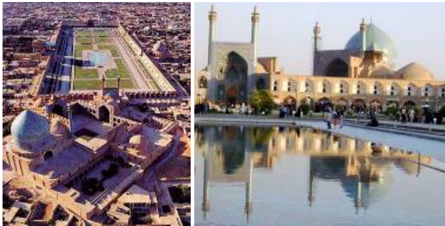
شکل ۵ نمایشی از میدان نقش جهان اصفهان که مسجد، مغازه‌های اطراف، حضور مردم و سایت میدان را در بافت کهن این شهر نشان می‌دهد