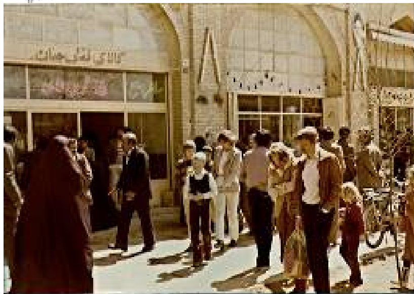
شکل ۴ محور بازار و بافت تجاری در جوار کاربری‌های متنوع تفریحی، مذهبی، گردشگری و... حول میدان ( http://vista.ir , http://tinypic.info )