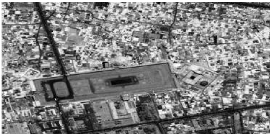
شکل ۳ میدان نقش جهان اصفهان، پلان مسجد امام در سمت راست تصویر و بافت شهری اطراف میدان

سوی نظریه‌پردازانی چون جیکوبز مبنی بر لزوم «تنوع کاربری و اختلاط آن‌ها در سطح شهر» مطرح شد. نمونه شاخص این پابندی به اصول دفاع‌پذیری فضا- که کاربری اراضی در آن با تنوع و اختلاط مناسب مورد توجه قرار گرفته است- در شهر تاریخی اصفهان و یادگارهایی چند از دوره صفوی از جمله میدان نقش جهان به چشم می‌خورد. میدان نقش جهان اصفهان از فضاهای مهم شهری در معماری و شهرسازی ایران است.