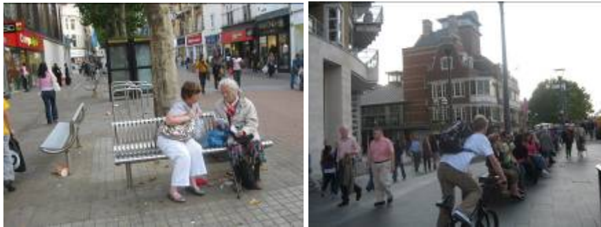
شکل ۱ افزایش سطح فعالیت در خیابان و فضاهای عمومی شهری

افزایش سطح فعالیت در خیابان و فضاهای عمومی شهری با پشتیبانی از سرمایه اجتماعی، کاربری پیاده را تشویق می‌کند و از میزان جرم و جنایت به‌طور محسوسی می‌کاهد (شکل ۱). اسکلمو آنجل ۱ ، یکی از پیشگامان اخیر CPTED، در رساله دکترای آنجل خود (۱۹۶۸) اذعان می‌کند: «محیط فیزیکی می‌تواند روی وضع جرم با تعیین قلمروها، کاهش یا افزایش دسترسی‌ها، با ایجاد یا حذف مرزها و شبکه‌های گردش، و با تسهیل نظارت توسط شهروندان و پلیس تأثیر مستقیمی بگذارد.» آنجل اثبات می‌کند میزان جرم به‌طور معکوسی با سطح فعالیت در خیابان‌ها مرتبط است (wikipedia, 2008).