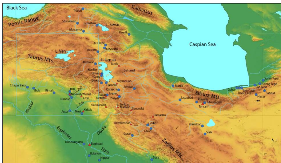
نقشه ۱: موقعیت جغرافیایی نیمه غربی ایران (Danti, 2013: fig. 1)

کاوش‌های پروژه حسنلو توسط موزه پسنیلوانیا و به سرپرستی دایسون در شمال غرب ایران را می‌توان نقطه عطف مطالعات باستان‌شناختی دوران آهن در ایران به شمار آورد. علاوه بر حجم وسیع کاوش‌ها، حسنلو یکی از قدیم‌ترین محوطه‌هایی بود که در آن آزمایش کربن ۱۴ انجام شد. چراکه اهداف اصلی از مطالعات این پروژه ایجاد گاهنگاری اصلی که در برگیرنده فازهای معین برای دوره‌های مختلف فرهنگی از دوران روستانشینی تا آغاز دوران تاریخی و به دست آوردن اطلاعات کامل و دقیق از پیشرفت‌های فن‌آورانه، سازمان‌های اجتماعی، معماری، سنن تدفین، و الگوهای استقرار و تلفیق و ارتباط دادن این اطلاعات و داده‌ها برای ایجاد یک تصویر وسیع‌تر از تاریخ ایران در این منطقه بوده است (Dyson, 1969: ۳۹).