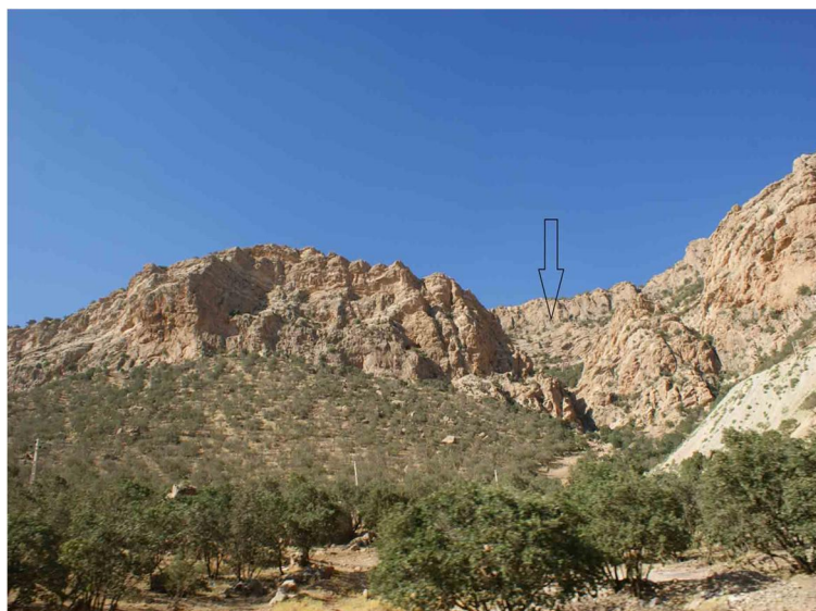
شکل 7 ایل‌راه تنگه قوچعلی

شرقی‌ترین قسمت پوان وارد قسمت انتهای شرقی قسمت دره‌ای آسمان‌آباد می‌شود که بعد از قطع دره سرسبز در آوهر 42 ، عبور از کنار غارها و پناهگاه‌های صخره‌ای این قسمت، گذشتن از منطقه جنگلی توه اماراو 43 و عبور از کنار روستای متروک کیه‌نی کمول به طرف قوچعلی می‌رود. از آنجا به راه‌های دیگر متصل، و همه راه‌ها یکی می‌شوند. بعد از این تنگه، دوباره راه‌ها از هم جدا می‌شوند. با پشت‌سر گذاشتن دشت ایلام از مسیر گردنه ماربره و سپاه‌کوه 45 وارد منطقه تخت خان 46 شده، در این منطقه پخش می‌شوند. در منطقه تخت خان نیز کتیبه‌ای از والیان حجاری شده که شجره‌نامه والیان است و به کتیبه قوچعلی شباهت دارد. از نظر کارکردی، می‌توان آن‌ها را با کتیبه بیستون و کتیبه‌های آشوری گل‌گل ملکشاهی و حیدرآباد می‌شخص 47 که در مسیر شاه‌راه خراسان بزرگ و مسیر آشوریان ایجاد شده، مقایسه کرد.