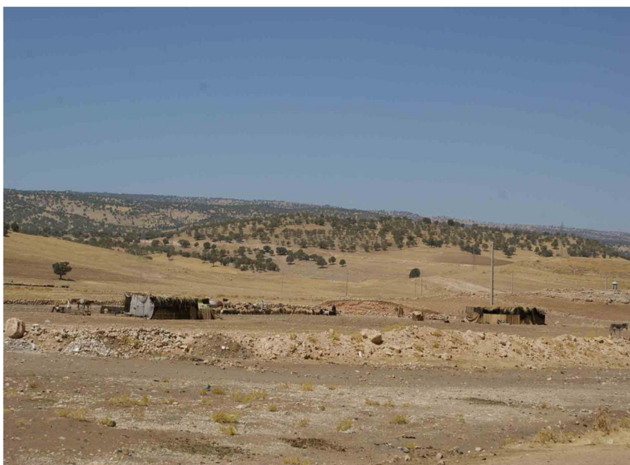
شکل 4 عشایر منطقه میشخاص با گله‌هایشان در دشت میان‌کوهی آسمان‌آباد - تابستان

محل اصلی این ایل، دهستان شوهان واقع در جنوب بخش ارکواز است. عشایر این ایل در مسیر حرکت خود از میدان زیتون، چالاب و چنگوله 24 تا حدود مرز عراق پیش می‌روند و دوباره موسم پنجه 25 برمی‌گردند و در ارتفاعات کبیرکوه مستقر می‌شوند. سردسیر این ایل آبادی‌های شوهان و گرمسیرشان نواحی مرزی مهران و دهلران است (شکل 4).