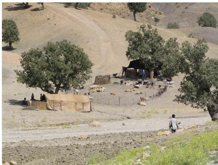
شکل 3 عشایر ایل ملکشاهی در منطقه ارکواز ملکشاهی

قلمرو این ایل از شمال به کبیرکوه، از جنوب به نواحی باغبانی و دره‌مالی در مرز عراق، از شرق به حدفاصل چشمه پهن (انتهای کبیرکوه) تا چالاب و از غرب به رود گُل‌گُل تا رضاآباد مهران محدود می‌شود. سردسیر ایل ملکشاهی بخشی از ارکواز، دهستان‌های گچی و چمنزاست. عشایر این ایل برای کوچ به نواحی گرمسیر (قشلاق)، اواسط آبان‌ماه از طریق کوه پشمینی حرکت می‌کنند، به محل‌های گاوی (بان شیطان و دشت شیطان) 22 و دشت محسن‌آباد می‌رسند و اواسط فروردین‌ماه از همان مسیر بازمی‌گردند. اساس اقتصادی ایل ملکشاهی مانند دیگر کوچ‌نشینان، دامداری است (شکل 3).