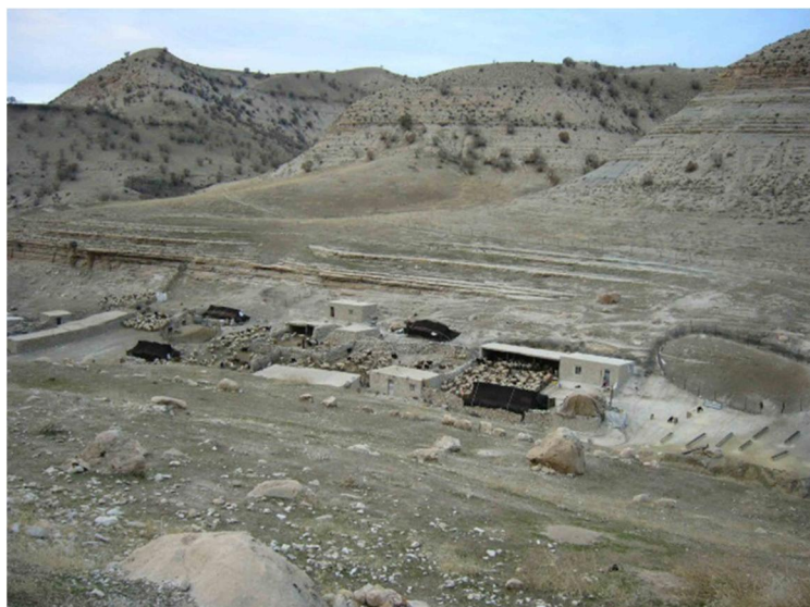
شکل 2 عشایر گله‌دار در منطقه پلپه ایوان - بهمن‌ماه