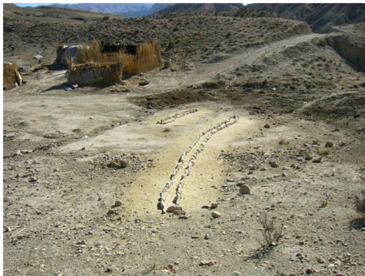
شکل 1 نمای کپر و محل علوفه دادن به احشام منطقه پلپه ایوان - بهمن‌ماه