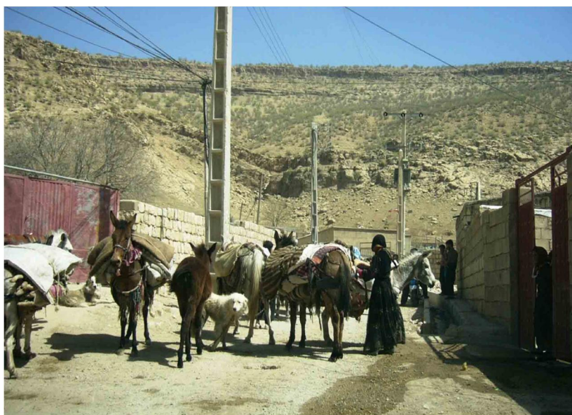
شکل 5 عشایر ایل زوله هنگام برگشت از گرمسیر - نوروز

ایل‌های میهمان نیز بیرانوند، ایل‌های زنگنه و زوله 28 هستند. امروزه، ایل بیرانوند در لرستان ساکن هستند و برای قشلاق به استان وارد می‌شوند. عده‌ای از آنان از طریق خرم‌آباد به سوی مازین دره‌شهر و دشت کلات کوچ می‌کنند و در آنجا ساکن می‌شوند. گروهی دیگر نیز به ناحیه دشت عباس می‌روند و از مراتع منطقه جهت چرای دام‌های خود استفاده می‌کنند. عشایر ایل‌های زوله و زنگنه هر سال از اوایل مهرماه، برای رفتن به گرمسیر از اطراف کرمانشاه و اسلام‌آباد غرب به سوی استان ایلام حرکت می‌کنند و پس از عبور از کوه قلاچه، از طریق چرداول (آسمان‌آباد و چرداول) به شیروان، بدره، آبدانان، دینارکوه، دشت فرخ‌آباد و برتش دهلران کوچ می‌کنند. در آنجا به دامداری و گله‌داری مشغول می‌شوند. اوایل فروردین هم از همان مسیر به سرزمین اصلی خود بازمی‌گردند (شکل 5).