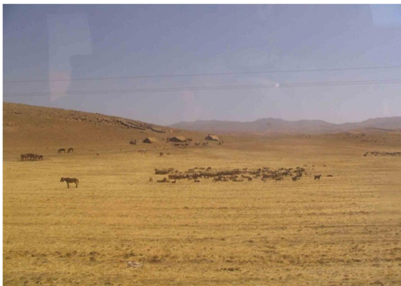
شکل 8 عشایر کوچ‌روی ترکاشوند در دشت نهایوند

اسلام‌آباد، زبیری، شیان و منصوری می‌شوند. پس از توقف کوتاه در این دشت‌ها، از مسیر تنگه قیر و تنگه حمیل به دشت چرداول وارد شده، در آنجا دوباره به دو شاخه تقسیم می‌شوند: عده‌ای به سمت قوچعلی می‌روند و بخشی دیگر مسیر را ادامه داده، بعد از عبور از تنگه شمشه وارد منطقه لومار، شیروان، بدره و رودبار می‌شوند و به نواحی شهرستان دره‌شهر می‌رسند. بعد از عبور از تنگه معروف ماژین، به نواحی شوهان، آبدانان و دهلران وارد می‌شوند و بخشی از سال را در این مناطق می‌گذرانند. با گرم شدن هوا (اوایل بهار) دوباره از همین مسیر به نواحی مرتفع برمی‌گردند. عده‌ای از گله‌داران دشت میان‌کوهی می‌شخاص در اوایل فصل تابستان برای چرای دام‌هایشان و استفاده از پس‌چر مزارع، به نواحی شمالی‌تر استان ایلام (دشت آسمان‌آباد و چرداول) کوچ می‌کنند و تا آخر تابستان با دام‌هایشان در آنجا به سر می‌برند (شکل 4). عشایر هلیلان، زردلان و هرسین نیز از مسیر دره سیمره (ترهان و رومشکان) هر ساله به نواحی جنوبی‌تر کوچ می‌کنند که دامنه کوچ آن‌ها علاوه بر دهلران و آبدانان، نواحی شمال خوزستان را نیز دربرمی‌گیرد. در فصل کوچ عشایری که منشأ آن‌ها نهایوند و گنگاور 48 است، نیز از این مسیر استفاده می‌کنند؛ هرچند تعداد آن‌ها اندک است (شکل 8).