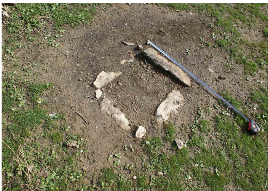
شکل 11 بقایای اجاق سیاه‌چادر کوچ‌نشینان در تنگ قیر

و سیاه‌کوه) را ممکن می‌سازد که به علت محدودیت این راه‌ها، سبب شکل‌گیری تقویم خاصی شده است (درست شبیه به ایستگاه‌های راه‌آهن و قطار) که مانع از درگیری و برخورد این کوچ‌نشینان می‌شد. این مساعی مشترک در کنار تهدیدهای مشترک موجب شکل‌گیری اتحادیه‌هایی در بین آن‌ها شد.