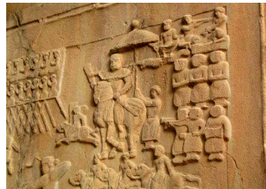
شکل 2 نوازندگان ردیف بالا در گروه نوازندگان: از سمت راست به احتمال نوازندگان کوس، روین نی و تاس