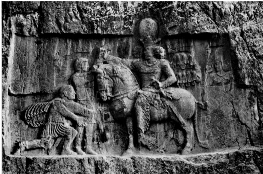
شکل 4. نقش برجسته‌ی پیروزی شاپور اول بر دو امپراتور روم: والرین که شاپور دست وی را به‌عنوان اسیر با دستان خود گرفته است و فیلیپ عرب که در مقابل او زانو زده است. در گوشه سمت راست نیز نیم‌تنه‌ی فوقانی موبد بزرگ کرتیر مشاهده می‌شود - نقش رستم فارس (Herrmann, 1969: Pl. VIIA)

در نقش برجسته‌ی مهم دیگری که پیروزی شاپور اول بر گردیانوس امپراتور روم را نشان می‌دهد (شکل 5)، شاهنشاه ایران در حال نوازش کردن سردار اسیرشده‌ی رومی است که برخی آن را والرین می‌دانند (برای اطلاعات بیشتر درمورد این نقش برجسته بنگرید به Herrmann, 1969: 87-88). اگرچه در تشخیص پادشاه، اختلاف نظرهایی بین محققان است، صرف‌نظر از نام او، نقش برجسته، الهام‌بخش رفتار اخلاق‌مدارانه‌ای است که شاهنشاه ساسانی نسبت به رقیب قدرتمند رومی از خود نشان می‌دهد. تردیدی نیست که این رفتار نیز در قالب دیدگاه جهان‌وطنی جای می‌گیرد، که یکی از مبانی اصلی آن اخلاقیات است. نقش برجسته، همچنین تعلیم و تبلیغ رفتاری مدنی از سوی شاه ساسانی به ساکنان این سرزمین است.