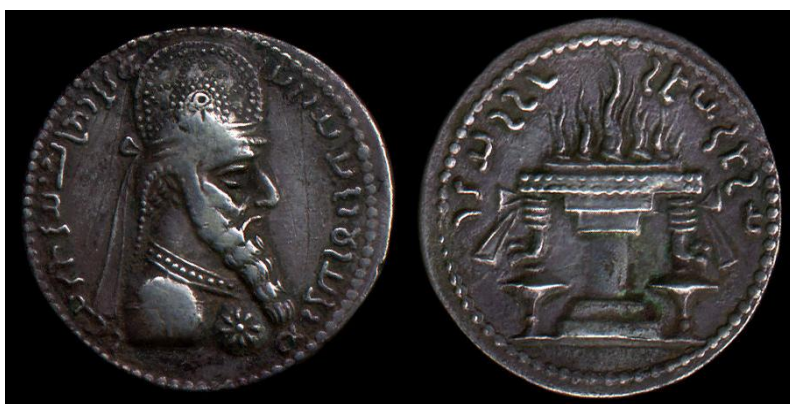
شکل 3. سکه‌ی اردشیر اول ساسانی (224-241 م.) که بر پشت آن آتشدانی نقش شده است (سرفراز و آورزمانی، 1387: تصویر 4، شماره‌ی 23)

به‌علاوه، کاربرد مستمر از نقش آتشدان در پشت سکه‌های تمامی شاهان ساسانیان (شکل 3) بیش از هر چیز نشان‌دهنده‌ی حاکمیت دستورهای زرتشت بر تمامی ابعاد زندگی ساکنان سرزمین اهورایی است. از آنجایی که سکه‌ها بیشتر از هر مصنوع دیگری در روابط بین‌المللی (از طریق تجارت) به‌کار گرفته می‌شدند، می‌توانستند نقش بی‌بدیلی را برای انتقال عقاید زرتشت به اقصا نقاط دنیای باستان ایفا کنند.