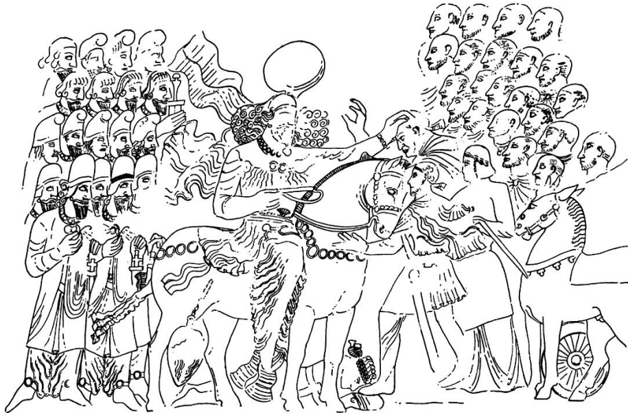
شکل 5. نقش برجسته‌ی پیروزی شاپور اول که در زیر پاهایش گردیانوس امپراتور روم دیده می‌شود؛ سناتورها و افسران رومی در مقابل شاه ایستاده‌اند که یکی از آن‌ها زانو زده است و شاپور برسر یکی از آن‌ها دست نوازش کشیده است (Herrmann, 1969: Fig. 10)

علاوه بر شواهد فرهنگی ملموس، منابع مکتوب بازمانده از عصر ساسانیان نیز در تشخیص اندیشه‌های سیاسی آنان راه‌گشا خواهد بود. اوستا 47 ، دینکرد، بُندهشن، دادستان دینیک، شکند گمانیک ویچار، مینوی خرد، ارداویراف‌نامه، زادسپرم، شایست و ناشایست از کتب مذهبی ساسانیان هستند که درباره‌ی تفکرات انسان نسبت به هستی و هم‌نوعانش مطالبی را در خود جای داده‌اند. از این میان، اوستا را می‌توان دایره‌المعارفی از مباحث مذهبی، فلسفی و حکمی، طب و نجوم به حساب آورد (Kellens, 2011: 32-33). به‌علاوه، کتب غیرمذهبی نظیر کارنامه‌ی اردشیر پاپکان، شهرهای ایران، آیین‌نامک، گاهنامک، نامه‌ی تنسر، درخت آسوریک و داستان خسرو کواتان ریدک، یادگار زرایران و نمونه‌های بسیار دیگری را - که در آن‌ها به شرح حال شاهان، شرح جنگ‌ها، فلسفه، هنر، ورزش، شهرهای ایران، تشکیلات دولت و سیاست‌های کشورداری پرداخته شده است (سامی، 1388 - جلد نخست: 148-144) - نیز مفید