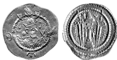
شکل 6 قباد اول

پس از مراجعت افزود و همراه با آن نیز دایره مدرجی به دور سکه اضافه می‌شود. سودآور در این‌جا به نظریه خود به نام «فره افزون» اشاره می‌کند. به عبارت دیگر او می‌خواهد بگوید که لغت افزون به تنهایی روی سکه کافی نیست بلکه باید جزیی از ترکیب «نوشته و تصویر» باشد یعنی ترکیب لغت با دایره اضافه شده، معادل واژه فره افزون است؛ زیرا در قبل قباد دستار فر به دور سر داشت و حالا دایره‌ای چون شمس که نماینده فره است به دور سر او اضافه شده بود تا معنی فره افزون از آن مستفاد شود. شکل 6، یک قاب گچین یافته شده در حوالی تیسفون، که سودآور (22:1383) عنوان می‌کند دومی‌اش آن را «افزون» خوانده نیز مشابه سکه قباد اول است که این بار حلقه مروارید و دو بالک نماد فره هستند و در نتیجه مفهوم فره افزون دیده می‌شود (شکل 7).