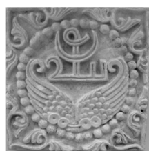
شکل 7 قاب گچین با ترکیبی از لغت افزون و دو بالک و

دستار و حلقه مروارید (سودآور، 1383، 167)