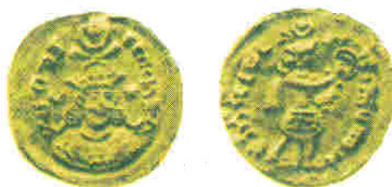
شکل 5 سکه طلای منحصر به فرد قباد اول (سکه‌های ساسانی)

در سال 33 حکومت قباد (امینی، 274:1389) یک حلقه پیرامونی به حلقه پشت سکه اضافه می‌شود (شکل 6). از تغییرات دیگر در نوشته‌های سکه می‌توان به افزودن کلمه «افزون» (یا «افزوت») روی سکه‌ها اشاره کرد (سودآور، 20:1383). در سکه‌های قباد اول چون او تاج و تخت را از دست داده بود و دو سال بعد به یاری هیاطله آن را پس گرفت، واژه «افزون» را