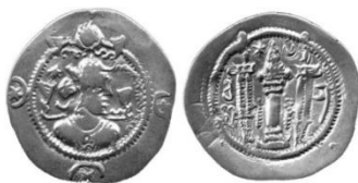
شکل 4 قباد اول - دوره دوم سلطنت (www.griffterrec.com, 2014/3/12)

تغییرات دیگر در سال‌های بعدی، سکه‌ای طلایی مربوط به بیست و پنجمین سال حکومت قباد است که روی سکه پادشاه از نمای روبه‌رو و در پشت سکه، در حال گرفتن حلقه قدرت ترسیم شده است (امینی، 1389:274) (شکل 5). اگرچه شخص دیگری که نمایش‌گر اهداگر حلقه به او است، وجود ندارد.