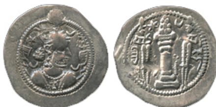
شکل 2 قباد اول - سکه دوره اول سلطنت