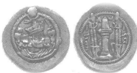
شکل ۱ قباد اول با تاج بلاش - سکه دوره اول سلطنت (سکه‌های ساسانی)

علایم به پشت سکه اضافه شده بود. همچنین دیهیم نیز به صورت نمای روبه‌رو و تقارنی مانند سکه‌های نوع سوم پیروز تصویر شده است. تا سال دوازدهم سلطنت قباد، گونه‌شناسی سکه‌ها به همین ترتیب باقی می‌ماند. نکته قابل توجه دیگر درباره قباد این است که او اصلاحاتی در سکه‌زنی، مانند تنظیم و نظارت بر ضرب، نشان اختصاصی سکه‌خانه و ذکر سال‌های سلطنت را در کنار پیگیری اصلاح نظام مالیاتی خسرو انوشیروان و آغاز مساحی زمین‌ها انجام می‌دهد (گوبل، 1382:137).