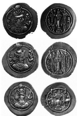
شکل 3 جاماسب - سکه‌های سال اول، دوم و سوم سلطنت

دادن این صحنه، حکومت خود را مشروع اعلام کند. این الگو در تمامی سکه‌های جاماسب در سال‌های سلطنت او دیده می‌شود و تنها تغییرات تدریجی از سال اول تا سوم حکومت او، بلندتر شدن نوار دیهیم اهدایی شخص دیگر به او است (شکل 3).