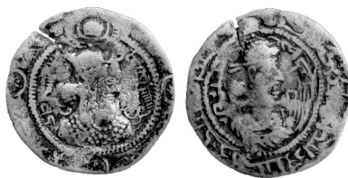
شکل 8 قباد اول - سکه مسی

اضافه‌شدن حلقه دوم از سال 33 حکومت قباد اتفاق می‌افتد و با توجه به اطلاعات کنونی نمی‌توان به سادگی دریافت که واژه افزون هم از سال 33 اضافه شده است یا خیر. در گروهی دیگر از سکه‌های او که مسی هستند تصویر خسرو اول (نوشیروان) در هنگام ولیعهدی در پشت سکه ترسیم شده که لقب او «شتردار» است (امینی، 1389:274). در این نوع سکه صرفاً یک حلقه در پشت سکه دیده می‌شود و ولیعهد هم دیهیم زیر شانه‌های شاه را ندارد (شکل 8). گوبل (1382:74) اشاره می‌کند که قباد اول در دینار ویژه‌ای واژه کی را می‌افزاید، همان‌گونه که یزدگرد دوم و پیروز نیز این اقدام را کرده بودند، اما در مورد زمان آن توضیحی نمی‌دهد.