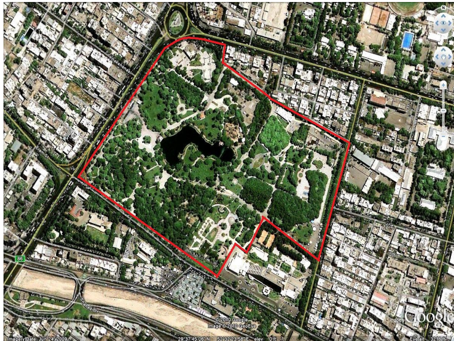
شکل ۲ پارک آزادی و کاربری‌های پیرامون

از نظر پاسخ‌گویان، وجود کاربری‌های مذهبی و انتظامی بالاترین احساس امنیت را دارند و کاربری‌هایی با تقاضای متراکم مانند شهر بازی، بازارچه خوداشتغالی و کاربری تجاری با غلبهٔ ارائهٔ کالاهای مردانه، کمترین احساس امنیت را به‌همراه دارند. مجاورت با شبکهٔ معابر اصلی که رفت‌وآمد در آن‌ها همیشگی است، از دیگر عوامل مؤثر بر افزایش احساس امنیت زنان استفاده‌کننده از پارک آزادی است. بر مبنای نتایج پرسش‌نامه، بیشتر پاسخ‌دهندگان در زمان مراجعهٔ فردی (تنها) به پارک، ترجیح می‌دهند در بخش‌هایی از پارک حضور یابند که پیرامون کاربری‌های مذهبی و انتظامی واقع شده و یا در فضایی از پارک که از طریق بلوار اصلی مقابل پارک قابل رؤیت باشد. از دیدگاه آنان، مراجعه به همراه اعضای خانواده به‌ویژه والدین و همسر، علاوه بر ایجاد احساس امنیت در آنان، زمینه‌ساز بهره‌مندی از خدمات کاربری‌های مختلف در سطح و پیرامون پارک نیز می‌شود.