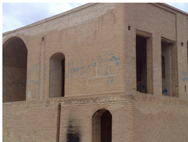
شکل ۳ ساختمان مجموعه گورهای زرتشتیان شهرستان یزد