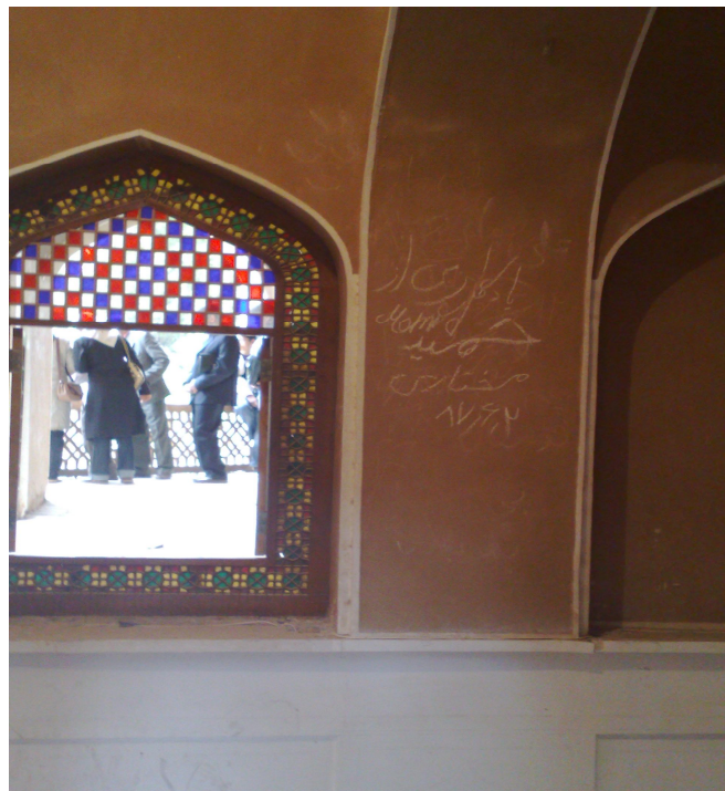
شکل ۲ اثر تاریخی: باغ دولت‌آباد شهرستان یزد