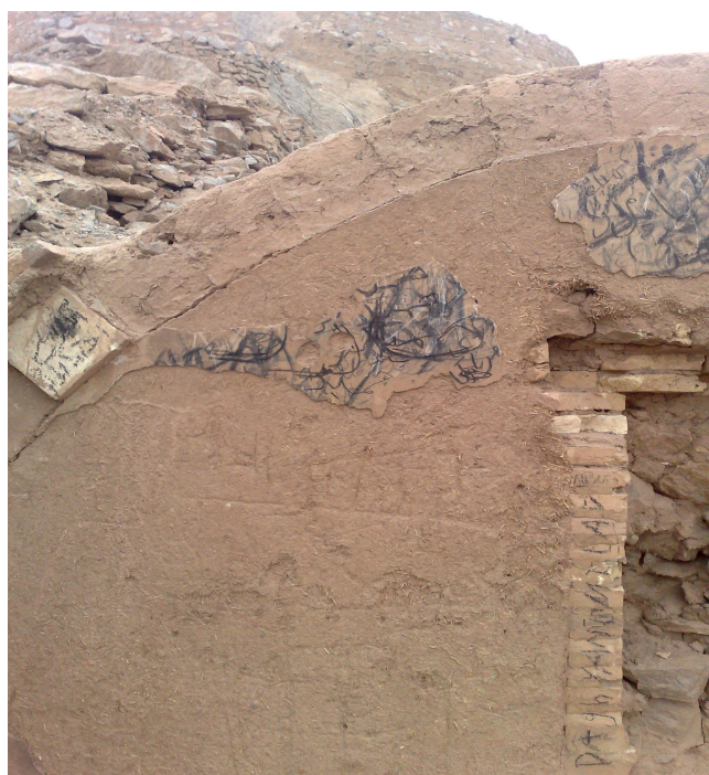
شکل ۱ اثر تاریخی: دخمه (گورهای زرتشتیان) شهرستان یزد

به‌منظور روشن شدن مقوله‌ی دیوارنویسی، تصویرهایی از دیوارنویسی بر مکان‌های تاریخی و باستانی شهرستان یزد آورده شده است: