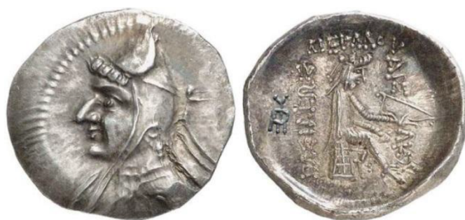
شکل 1 یک درهمی نوع مهرداد اول از ضربخانه اکباتان (S14. 10)

فعالیت ضربخانه هگمتانه از اواخر دوران حکومت مهرداد اول آغاز شده و تا پایان این امپراتوری همچنان ادامه می‌یابد. اولین گروه از سکه‌های این ضربخانه، یک درهمی‌هایی (S10. 10) و (S 10. 14) است که بلافاصله پس از فتح هگمتانه در سال 148 ق. م ضرب شده‌اند. در این سکه‌ها مهرداد اول با کلاه باشلقی به تصویر کشیده شده است؛ درحقیقت، این سکه‌ها آخرین سری از سکه‌های کلاه باشلقی اشکانی هستند. (تصویر 1) (غلامی، 1392: 57)