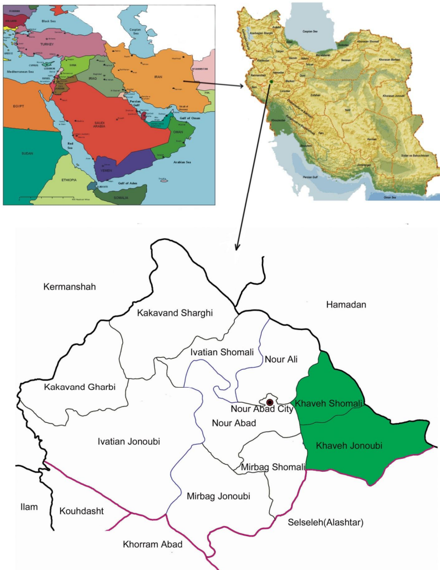
شکل 1 موقعیت شهرستان دلفان و دشت خاوه