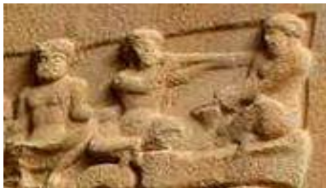
شکل 2 نوازندگان ردیف بالا در گروه نوازندگان: از سمت راست به احتمال نوازندگان کوس، روپین نی و تاس