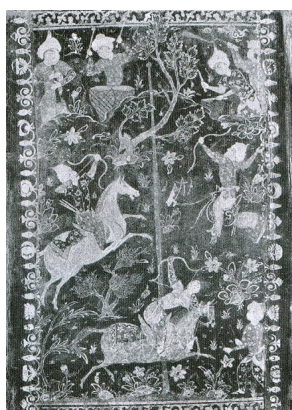
شکل 4 تصویر شکار شاهی با همراهی نوازندگان، جلد لاک‌ی صفوی، سده ده هجری قمری، انجمن سلطنتی آسیایی، (پوپ و آکرمن 1378: لوح 971)