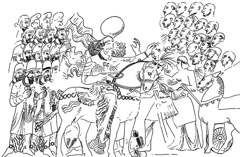
شکل 5. نقش برجسته‌ی پیروزی شاپور اول که در زیر پاهایش گردیانوس امپراتور روم دیده می‌شود؛ سناتورها و افسران رومی در مقابل شاه ایستاده‌اند که یکی از آن‌ها زانو زده است و شاپور برسر یکی از آن‌ها دست نوازش کشیده است (Herrmann, 1969: Fig. 10)

علاوه بر شواهد فرهنگی ملموس، منابع مکتوب بازمانده از عصر ساسانیان نیز در تشخیص اندیشه‌های سیاسی آنان راه‌گشا خواهد بود. اوستا 47 ، دینکرد، بُندهشن، دادستان دینیک، شکند گمانیک ویچار، مینوی خرد، ارداویراف‌نامه، زادسپرم، شایست و ناشایست از کتب مذهبی ساسانیان هستند که درباره‌ی تفکرات انسان نسبت به هستی و هم‌نوعانش مطالبی را در خود جای داده‌اند. از این میان، اوستا را می‌توان دایره‌المعارفی از مباحث مذهبی، فلسفی و حکمی، طب و نجوم به حساب آورد (Kellens, 2011: 32-33). به‌علاوه، کتب غیرمذهبی نظیر کارنامه‌ی اردشیر پاپکان، شهرهای ایران، آیین‌نامه، گاهنامه، نامه‌ی تنسر، درخت آسوریک و داستان خسرو کواتان ریدک، یادگار زرایران و نمونه‌های بسیار دیگری را - که در آن‌ها به شرح حال شاهان، شرح جنگ‌ها، فلسفه، هنر، ورزش، شهرهای ایران، تشکیلات دولت و سیاست‌های کشورداری پرداخته شده است (سامی، 1388 - جلد نخست: 148-144) - نیز مفید