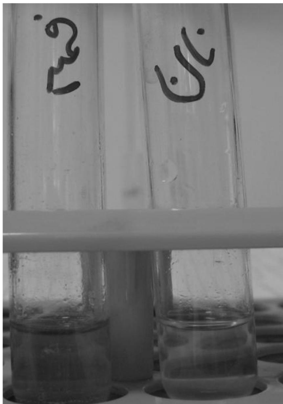
شکل ۱ بررسی میزان نشاسته در نمونه خمیر و نان داری باکتری

آزمایش انجام شده با استفاده از معرف لوگول، شدت رنگ کمتری را در نمونه نان مورد آزمایش نسبت به خمیر نشان داد، که این امر حاکی از آن است که نشاسته در نان پخته شده توسط باکتری‌های موجود در آن هیدرولیز شده است.